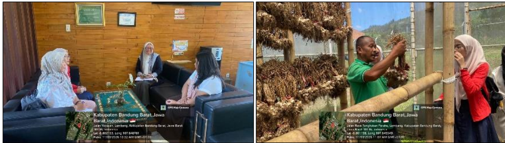
Gambar 6. koordinasi dan survei lokasi penerapan teknologi Instore Dryer (ID) untuk benih bawang putih