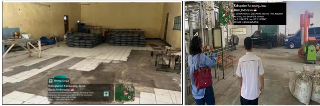
Gambar 5. Survei lapang penentuan kapasitas alat yang sesuai dengan kebutuhan operasional, serta pembahasan tata letak (layout)