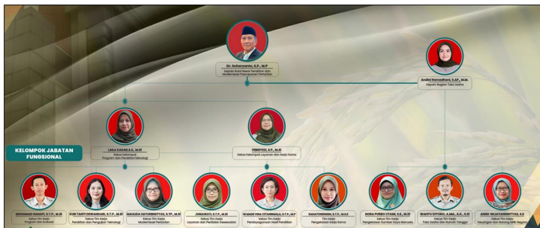
Gambar 1. Struktur organisasi BBPM Pascapanen Tahun 2026

melaksanakan kegiatan seminar secara berkala. Pengembangan SDM dilakukan pula dengan cara memberikan kesempatan kepada pegawai BBPM Pascapanen untuk melanjutkan studi ke jenjang pendidikan yang lebih tinggi dan mengikuti berbagai kegiatan pelatihan yang diselenggarakan di dalam maupun luar negeri.