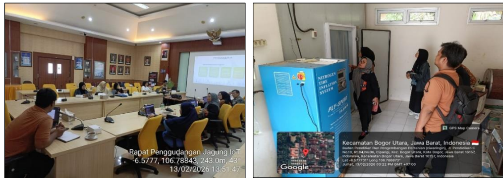
Gambar 4. Koordinasi internal & peninjauan terkait desain dan kebutuhan material IoT